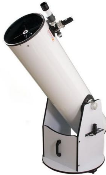
Newton sur monture de Dobson

Latitude5050 a été fondé par Jacques Duffaut en 2012 ; le Club tient ses réunions un vendredi sur deux, aux FBP, 365b rue au Bois ; pour plus d'information : contact@latitude5050.be ; pour devenir membre, rendez-vous sur le site du Club : https://www.latitude5050.be